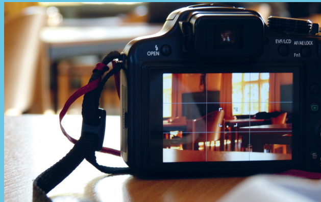
Icons: freepik.com, NY Puell