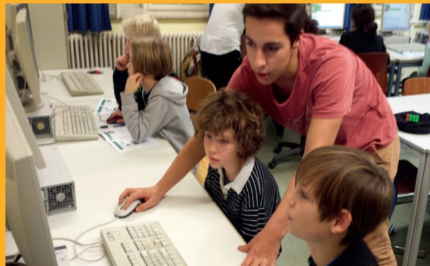
Fotos: M. Alms, A. Hüneberg, A. Kleuker, J. Homung Icons: freepik.com