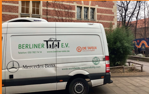
Fotos: André Hüneberg, Charlotte Keuer Icons: freepik.com, NY Puell